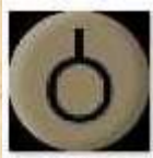
Fusiliers & Antichar