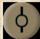
Mitrailleuse légère (FM)

pattuglia di osservazione e collegamento